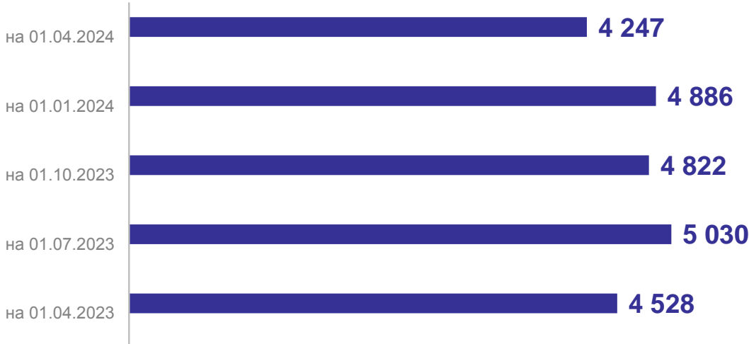
Задолженность граждан, оплачивающих жилищно-коммунальные услуги через управляющие организации млн рублей