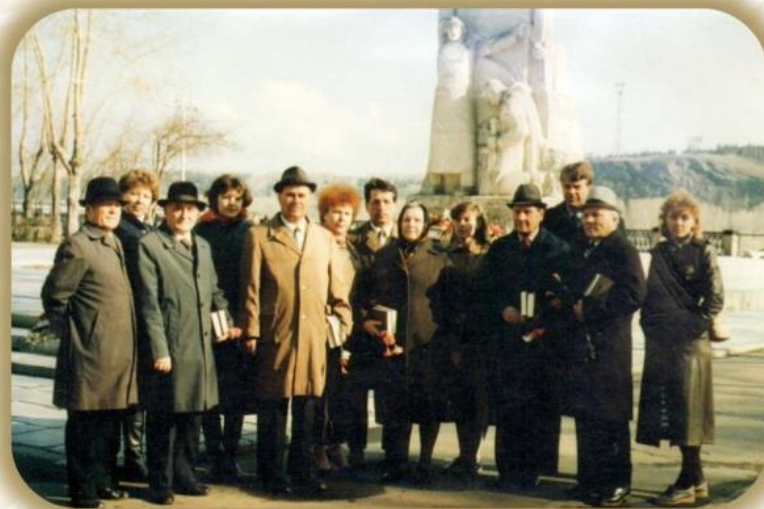
Праздничная манифестация. Кемерово, 9 мая 1986 года

Ко времени начала шахтёрских забастовок в центре внимания общества оказались социальные проблемы. Общественный интерес сказывался на характере деятельности статистики. В этот период были проведены: учёт бесплатных, частично и полностью оплаченных населением услуг, оказанных предприятиями и организациями (1985), выборочное обследование численности и состава пенсионеров (1987), учёт трудоустройства молодёжи (1987), обследование причин текучести кадров (1987), обследование предполагаемого использования денежных сбережений (1987), обследование качества, сроков исполнения заказов и культуры обслуживания населения (1987). Были написаны актуальные записки: "Основные показатели производственной деятельности промышленных предприятий, работающих в новых условиях хозяйствования" (1985), "Удовлетворение спроса различных возрастных групп населения на одежду и обувь" (1987), "О соответствии производства товаров спросу населения" (1987), "Соотношение темпов роста денежных доходов и расходов населения области" (1988).