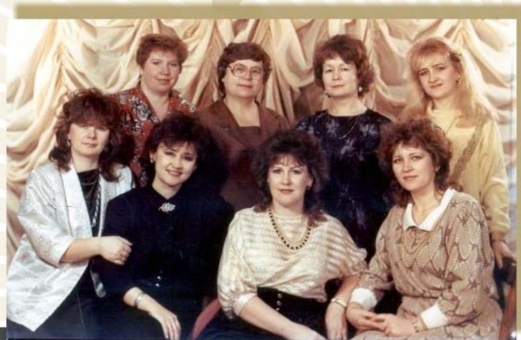
Отдел статистических задач Облстатуправления. Кемерово, 1989 год

Стала заметна тенденция к значительному повышению оперативности в подготовке и представлении экономико-статистической информации. Сводные итоги практически по всем разрабатываемым формам отчётности стали публиковать в виде экспресс-информаций и справок в основном, в день окончания разработки или на следующий день. Большой оперативности в доведении информации удалось достичь благодаря переводу её обработки на ПЭВМ. Начала развиваться коммерческая деятельность по реализации информации.