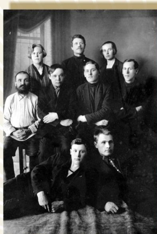
Всесоюзная перепись мелкой промышленности. 1-й инструкторский участок. Щегловск, 1930 год

Совершенствовалась и статистика. В период с 1931 по 1941 год получили развитие работы по совершенствованию бухгалтерского и статистического учёта на промышленных предприятиях, унификации форм учёта и отчётности. ЦСУ было организовано централизованное производство бланков и распространение типовых альбомов форм учёта.