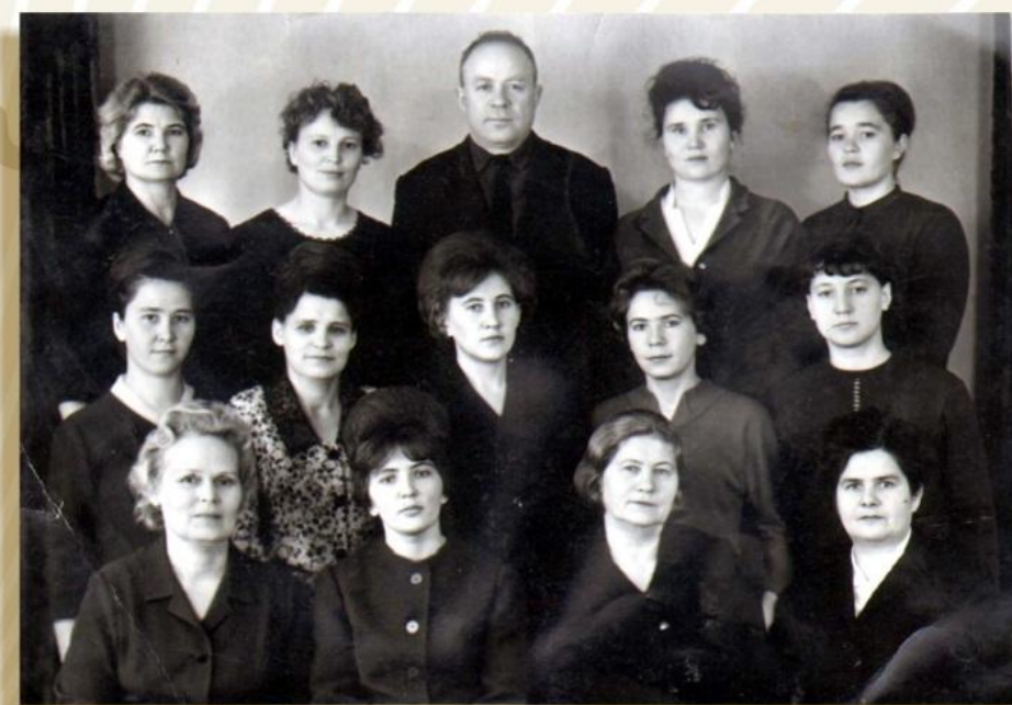
Лучшие по профессии. Кемерово, 1963 год

В 60-е годы был проведён ряд интересных обследований: учёт введённых, строящихся, а также находящихся на консервации или приостановленных строительством клубных учреждений (1964), выборочное обследование занятости населения городов (1965), учёт результатов перевода работников на новые условия труда (1965), учёт приёма на работу молодёжи (1968), учёт численности работающих пенсионеров (1969), выборочное обследование постоянных дошкольных учреждений (1970).