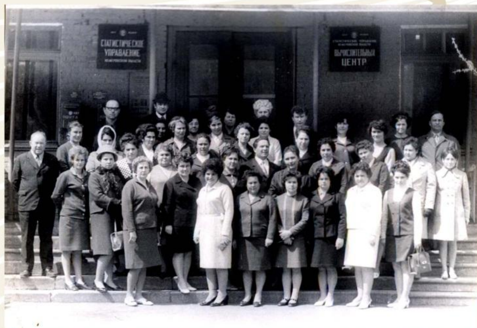
Областное совещание статистиков Кемерово, 1973 год