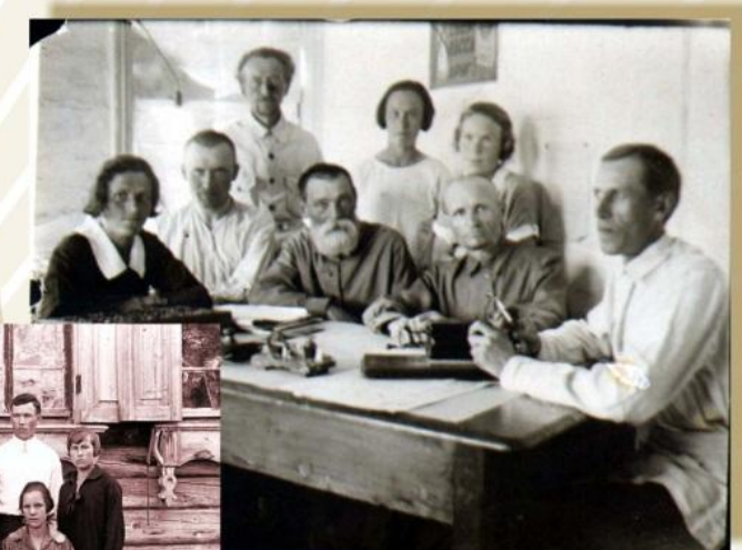
Кузнецкое окрстатбюро. Щегловск, 1930 год

Бюджеты рабочих наблюдались в Щегловске - на шахтах и химзаводе. Разработка их (а также и результатов обследования крестьянских хозяйств) производилась в Крайстатуправлении, туда же отправлялись и отрывные талоны по естественному и механическому движению населения. Установка на передачу большинства разработок из краевой статистики в окрстатотдел способствовала его превращению "из собирателя сведений в законченную статистическую организацию".