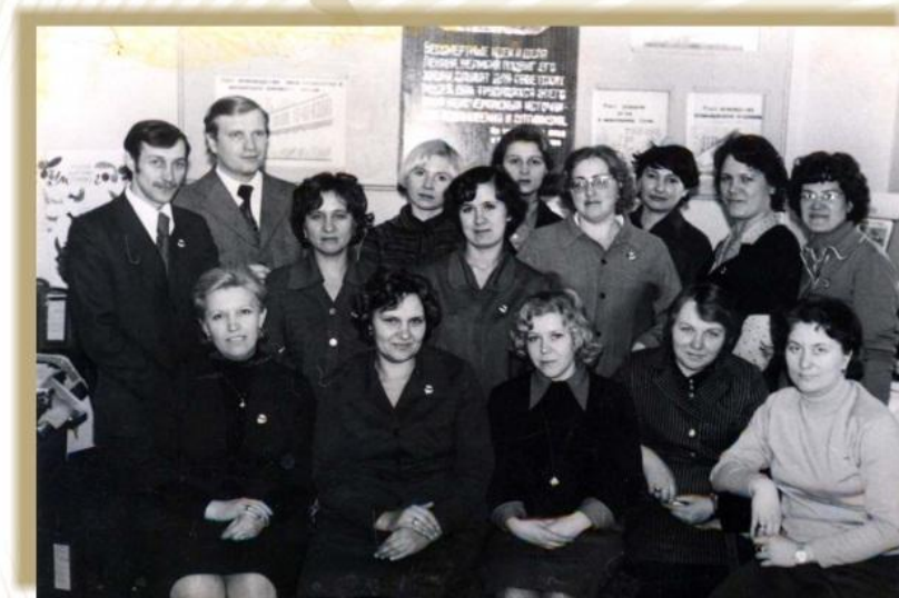
Всесоюзная перепись населения. Инструкторский участок. Юрга, 1979 год

В 1979 году была успешно проведена Всесоюзная перепись населения, областным Вычислительным центром, который являлся кустовым по зоне Западной Сибири, была выполнена механизированная разработка материалов переписи пяти сибирских краёв и областей.