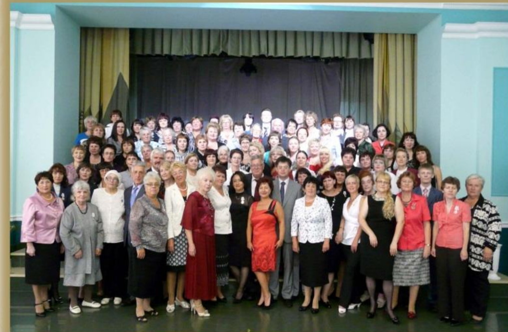
Губернаторский прием в честь 200-летия российской статистики. Кемерово, август 2011 года

По Распоряжению Губернатора Кемеровской области А.Г. Тулеева заслуженным работникам Кемеровостата выделены 3 льготных бюджетных займа для улучшения жилищных условий (приобретение квартиры).