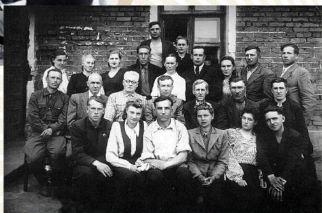
Совещание инспекторов областного статуправления. Кемерово, 1950 год