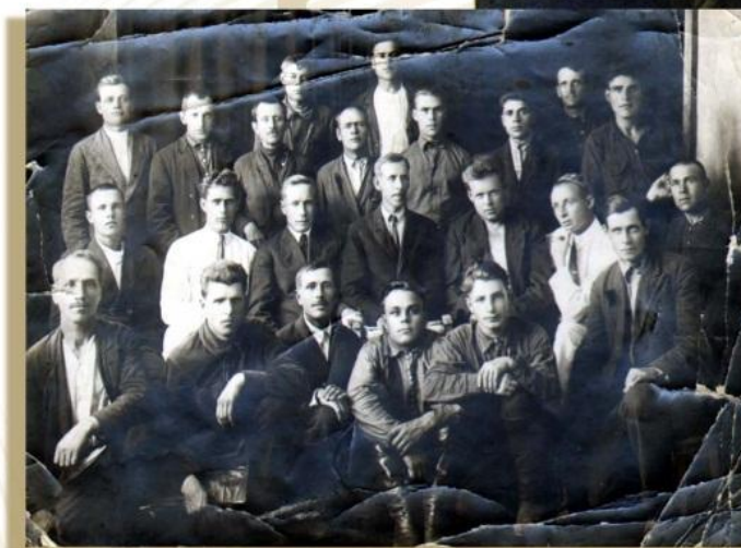
Съезд инспекторов Управления Нархозучета. Кемерово, 1938 год

В начале 1941 года ЦУНХУ было переименовано в ЦСУ при Госплане СССР, а его территориальные управления – в областные статистические управления.