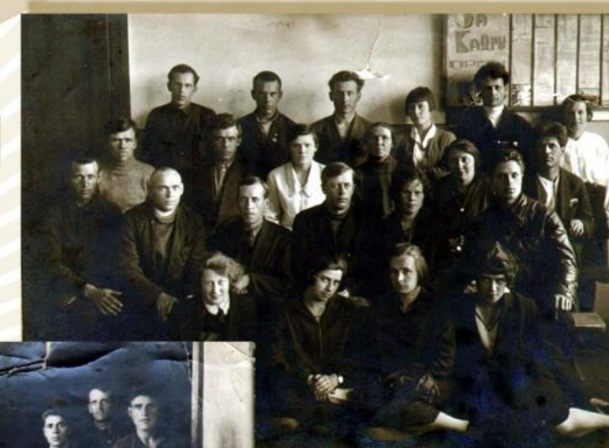
Курсы плановых работников. Кемерово, 1932 год

Сохранился акт о состоянии дел в Кемеровской инспектуре Нархозучёта на 4 января 1938 года. Наличный штат инспектуры составляли 10 человек - экономисты и статистики (машинистки и уборщицы работали по совместительству). Из них лишь двое имели стаж более 3 лет. В документе работники охарактеризованы следующим образом: «С деловой точки зрения штат вполне пригодный». Имущество инспектуры составляли легковая автомашина ГАЗ «А», 2 велосипеда, 3 лошади с упряжью, трое саней, 2 арифмометра, 11 конторских счётов, 12 письменных столов, 3 рамы с портретами, часы-ходики и библиотека из 710 книг. О выполнении работ было сказано: "Все текущие работы и очередные задания выполнены в срок".