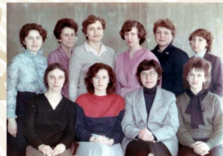
Областной вычислительный центр. Отдел эксплуатации ЭВМ. Кемерово, 1980 год