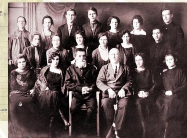
Кузнецкое окрстатбюро. Щегловск, 1925 год