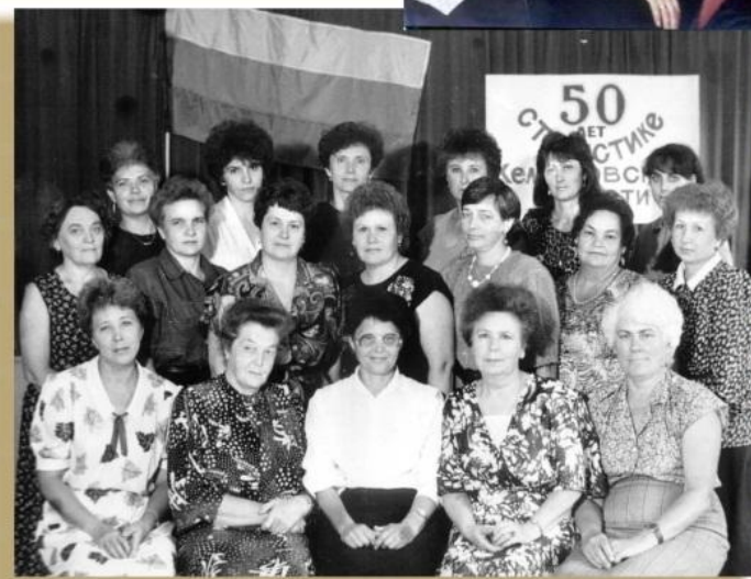
Празднование 50-летия статистики области. Кемерово, 1993 год

22 сентября 1994 года постановлением Госкомстата Кемеровское областное управление статистики было преобразовано в Кемеровский областной комитет государственной статистики.