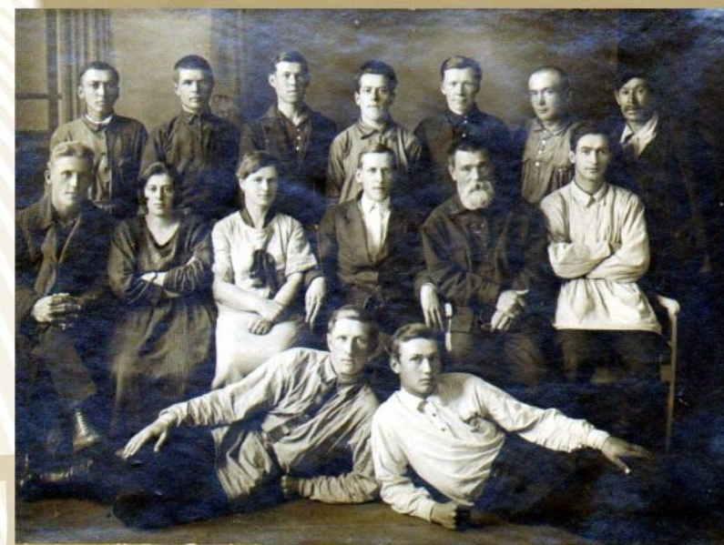
1-й съезд районных статистиков Кузнецкого округа. Щегловск, 1927 год

В 1925 году, в связи с административной реформой в стране, был создан Кузнецкий округ (центр – г.Щегловск), входивший в состав Западно-Сибирского края (центр – г.Новосибирск). В Кузнецком округе появился окрстатотдел, подчинённый Новосибирскому крайстатуправлению, в котором были сектора статистики сельского хозяйства, промышленности, труда, включая бюджеты рабочих, сектор, в круг работ которого входили торговля, финансы, коммунальное хозяйство, статистика населения, культуры и здравоохранения.