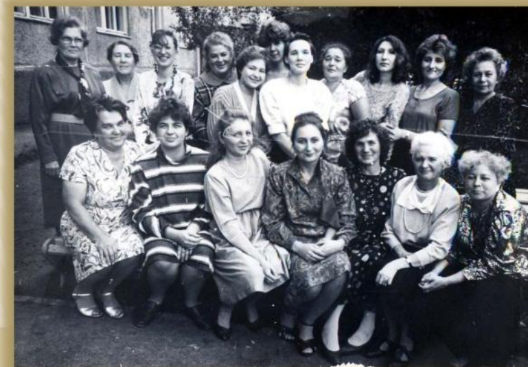
Отдел статистики бюджетов домашних хозяйств. Кемерово, 1992 год

В 90-е годы, с началом глобальных экономических реформ, основными объектами наблюдения стали приватизация, разгосударствление, образование новых хозяйствующих субъектов, развитие малого предпринимательства, формирование частного сектора, движение товаров, состояние взаиморасчётов, повышение роли непромышленного сектора экономики, уровень жизни, безработица.